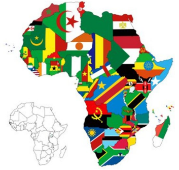
AFRIQUE Afrique Afrique