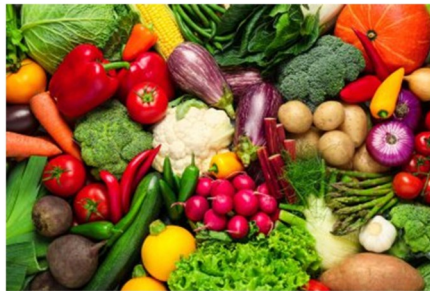
LÉGUMES légumes légumes