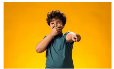
MOQUE moque moque