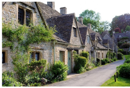
VILLAGE village village