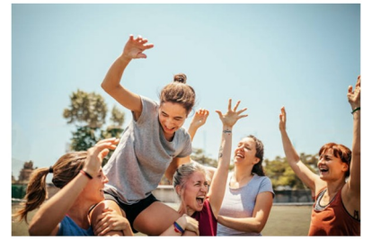
PORTE EN TRIOMPHE porte en triomphe porte en triomphe