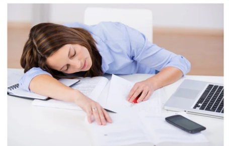
EPUISÉE épuisée épuisée