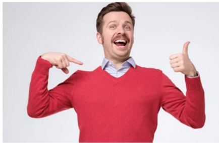
FANFARON fanfaron fanfaron