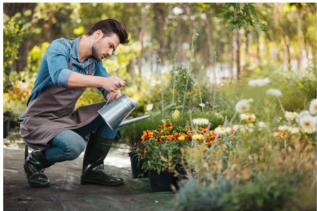
JARDINIER jardinier jardinier