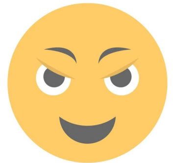
SOURIRE MOQUEUR sourire moqueur sourire moqueur