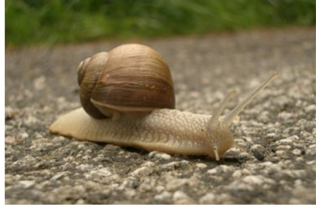
ESCARGOT escargot escargot