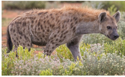
HYÈNE hyène hyène