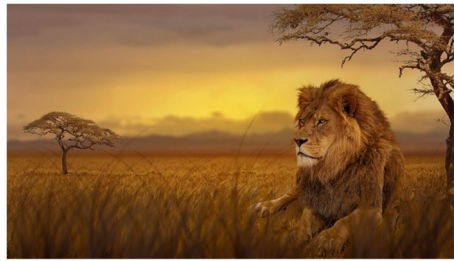
SAVANE savane savane