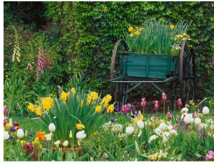
JARDIN jardin jardin