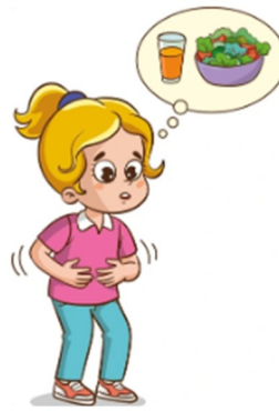
AFFAMÉ affamé affamé