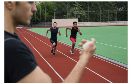
COURSE course course